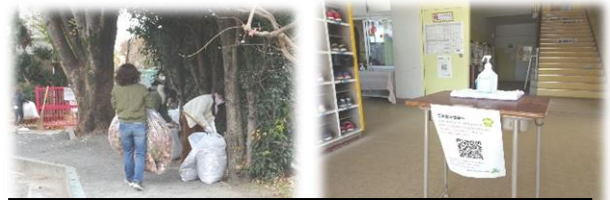
たくさんの方のご協力で、行事もできています。ありがとうございます

10/31の学校公開、11/26の持久走大会と行事が続いた1か月でした。参観・応援そしてたくさんのご協力ありがとうございました。新型コロナウイルス感染症の収束がまだ見えない中ですが、保護者・地域の皆様のお力添えのおかげで、充実の秋となりました。