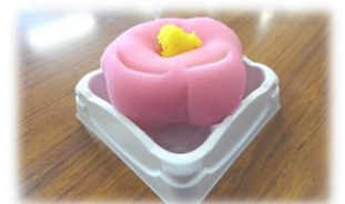
美しさも味も最高の和菓子でした