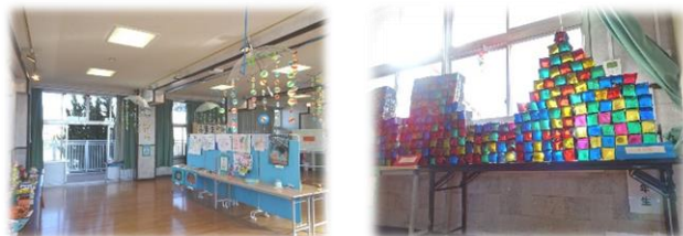
ステキな作品をみんなで楽しみました!

2/8(月)~10(水)の3日間の公開、延べ80人超のご参観をいただきました。感染防止へのご配慮・ご協力もありがとうございました。校内でも、全クラスが太陽展を見学するなど、貴重な機会となりました。