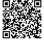
公式ツイッターはこちら

なお、日々の学校の様子は「志木第三小学校公式ツイッター」で発信していきます。災害時等には、緊急情報の発信・共有にも使用します。ぜひフォローをお願いします。